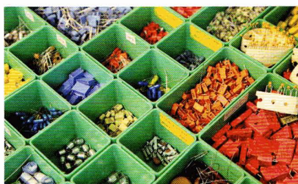
Blick in die «Zauberkiste» der Elektronik

Elektronik begleitet unser Leben auf Schritt und Tritt. Wenn wir das Licht einschalten, ein Auto starten, den Lift benutzen, wenn Lichtsignale den Verkehr steuern, Handys Daten empfangen, Alarmanlagen vor Einbrechern warnen, überall ist Elektronik im Spiel. Zu den wenigen, die sich darüber vertieft Gedanken machen, zählen sicher die Teilnehmenden eines Elektronik-Kurses am JEZ. Hier erhalten Jugendliche ab 11 Jahren einen Einblick in die Welt der Elektronik. In praxisorientierten Kursen lernen sie unter Anleitung von versierten Instruktoren den Umgang mit Werkzeugen und Geräten. Sie erhalten aber auch einen vielfältigen Einblick in die Praxis, sei dies beim Bau eines Solar-Modellautos, einer Alarmanlage, einer Wetterstation oder eines Radio-Empfängers.